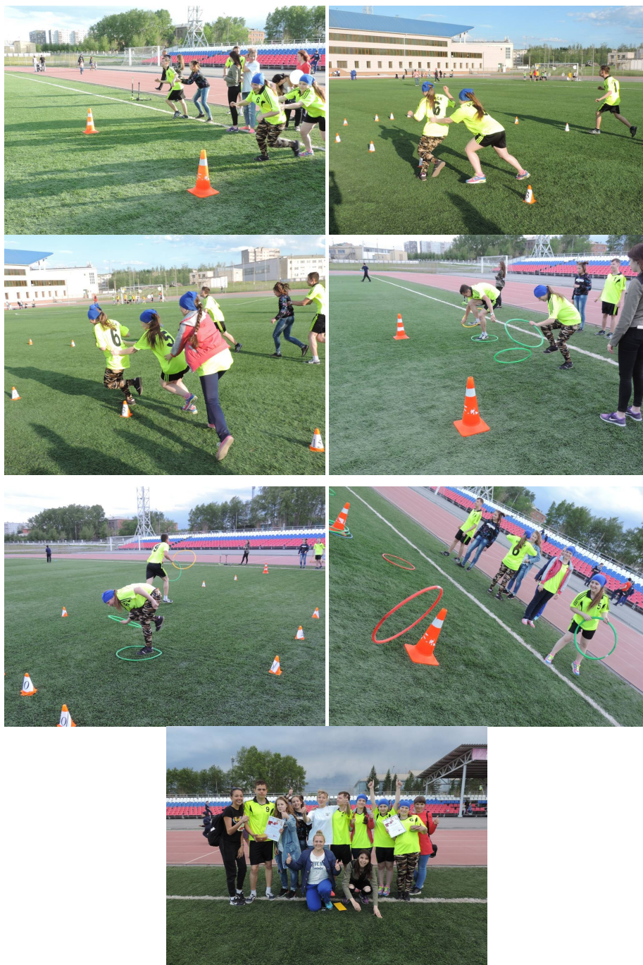
Студенты и преподаватели нашего техникума приняли участие в I Красноярском зональном фестивале искусств медицинских работников, посвященном Дню медицинского работника